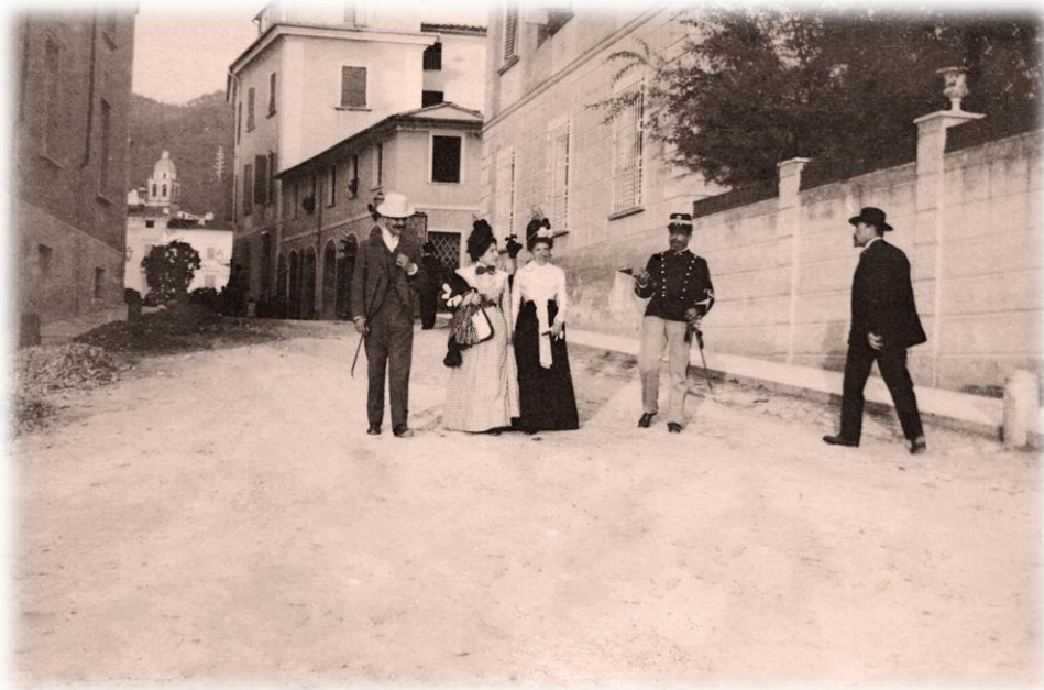
Massa, Via Ghirlanda_1900

Il Ballo Rinascimentale_primi passi | laboratorio di danza per bambini e adulti | A cura di Associazione Culturale Antica Massa Cybea con il Gruppo Danze Storiche "La Riverenza" | Museo Diocesano